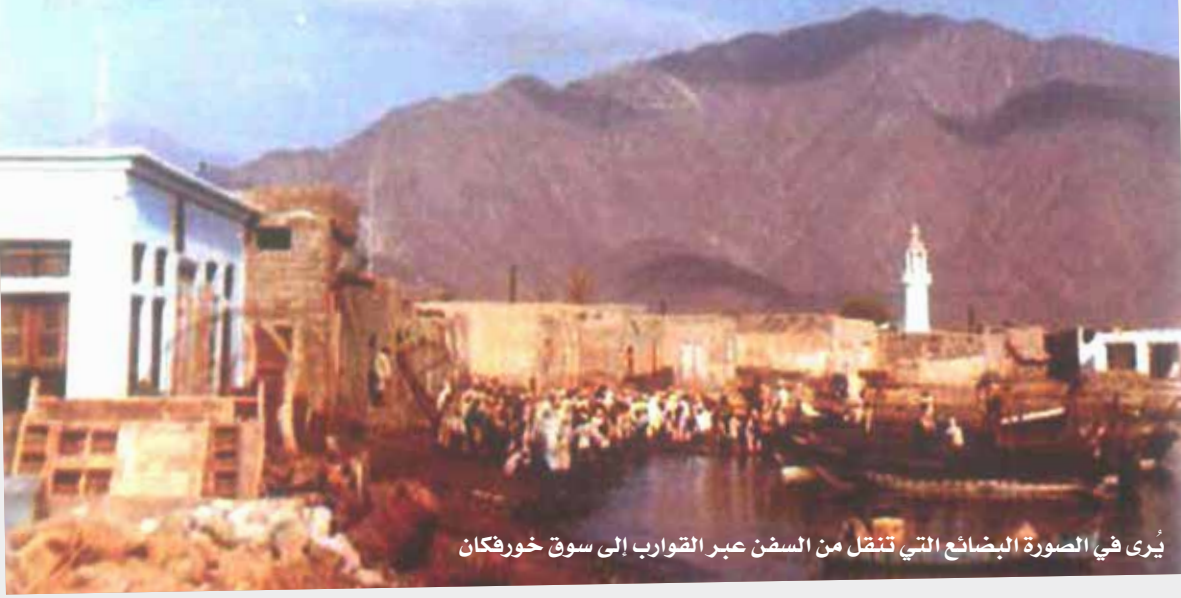
يُرى في الصورة البضائع التي تنقل من السفن عبر القوارب إلى سوق خورفكان