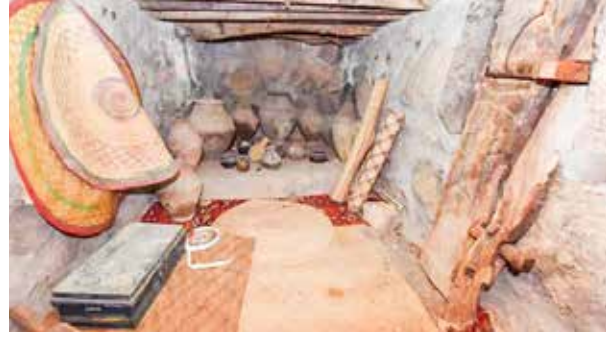
القفل من الداخل

والنباتات الجبلية، وجلب الماء ورعي الأغنام وطحن الحبوب، وأما الرجل فينطلق لأعماله في الزراعة وبيع الفواكه والنباتات العشبية في المناطق القريبة والأسواق.