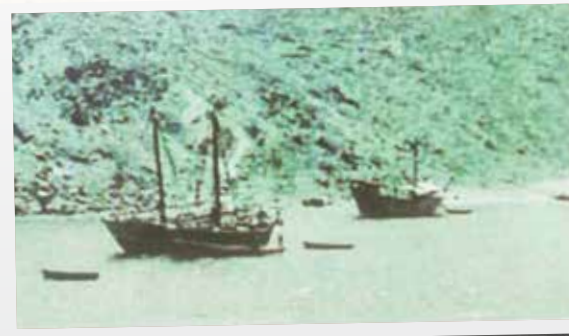
بندر خورفكان ترسو فيه السفن الخشبية