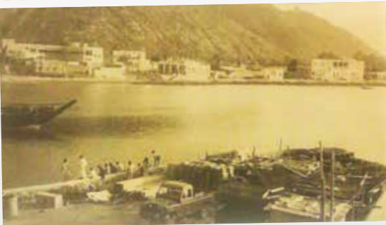
فرضة خورفكان في سبعينيات القرن الماضي

تظهر الصورة الثالثة ميناء خورفكان وهو يحتضن أسطولاً تجارياً من السفن الشراعية التقليدية، لسكان المنطقة، وكان الأهالي يحرصون على تسمية سفنهم بأسماء مميزة مثل «فتح