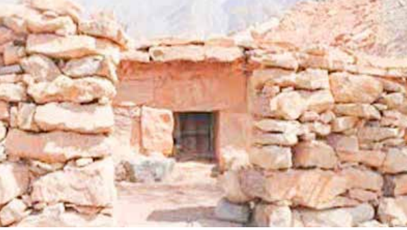
تكون فتحة البيت قبيلة الارتفاع