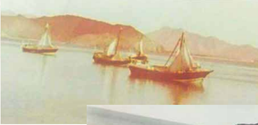
سفن خشبية راسية في خورفكان